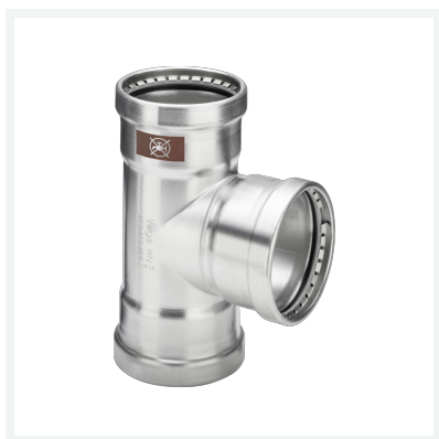
Temponox XL-trójnik z SC-Contur nr wzoru 1718XL nr kat. 810 795