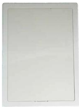
Dane techniczne ograniczników temperatury na powrocie RTL-box, głowica ukryta