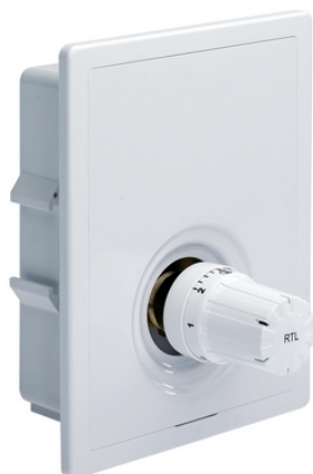
Dane techniczne ograniczników temperatury na powrocie RTL-box, głowica na zewnątrz