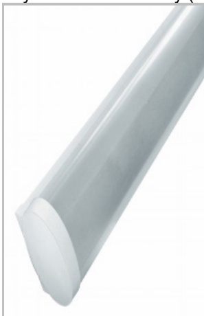
WIDOK W STANIE NIEAKTYWNYM (napis niewidoczny)